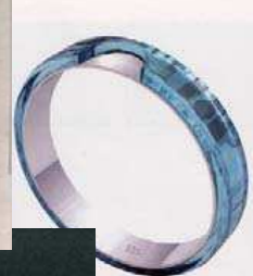
Singelringen i turkos.