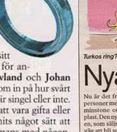
Singelringen i turkos.